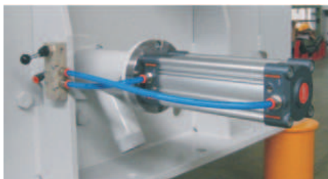
ПНЕВМАТИЧЕСКОЕ УСТРОЙСТВО ДЛЯ ИЗВЛЕЧЕНИЕ ПРОБ