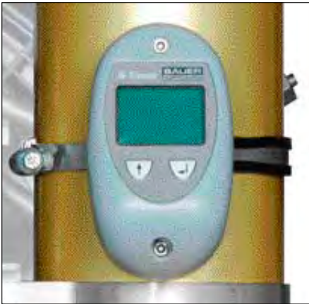
Таймер B-TIMER для контроля состояния фильтрующей системы