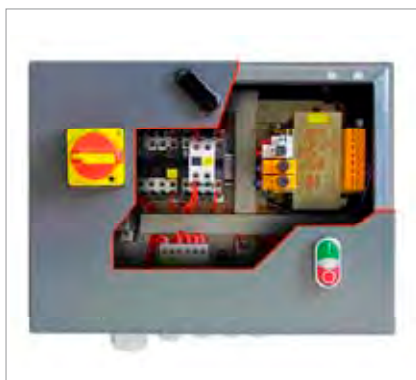
Блок управления компрессором