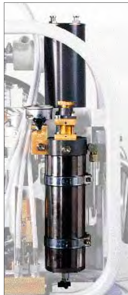
Фильтрующая система P41