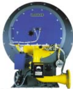
GLS, GS, LS