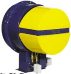
TGL, TG, TL