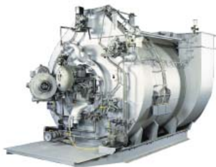
Генераторы горячего газа 1 МВт - 50 МВт

Генераторы горячего газа SAACKE с горелками всего диапазона мощностей применяются для получения горячих газов, используемых для сушки, дожигания дымовых газов в дымоочистных установках, для сжигания специальных горючих веществ и уничтожения вредных веществ.