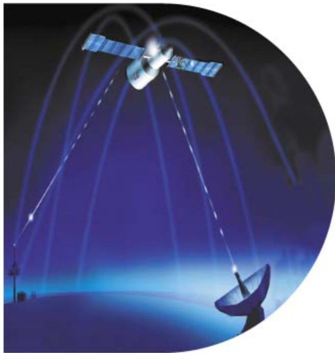
При дистанционной диагностике по системе "Телесервис" не требуется выезд работников сервисной службы.

Главная цель нашей службы сервиса - обеспечить Вашему горелочному устройству долгий срок службы, экономичность, соблюдение требований охраны окружающей среды и надежность!