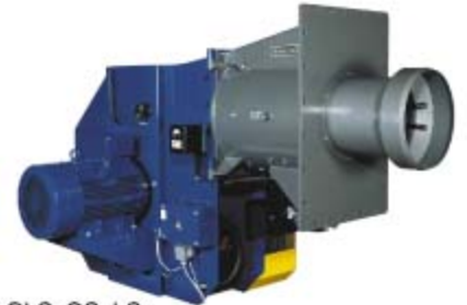
GLS, GS, LS